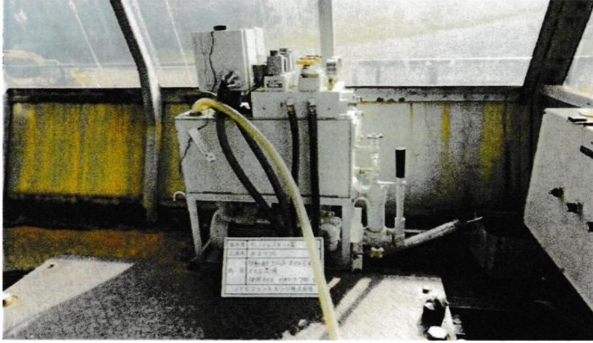
制動油圧ユニットオイル交換工事