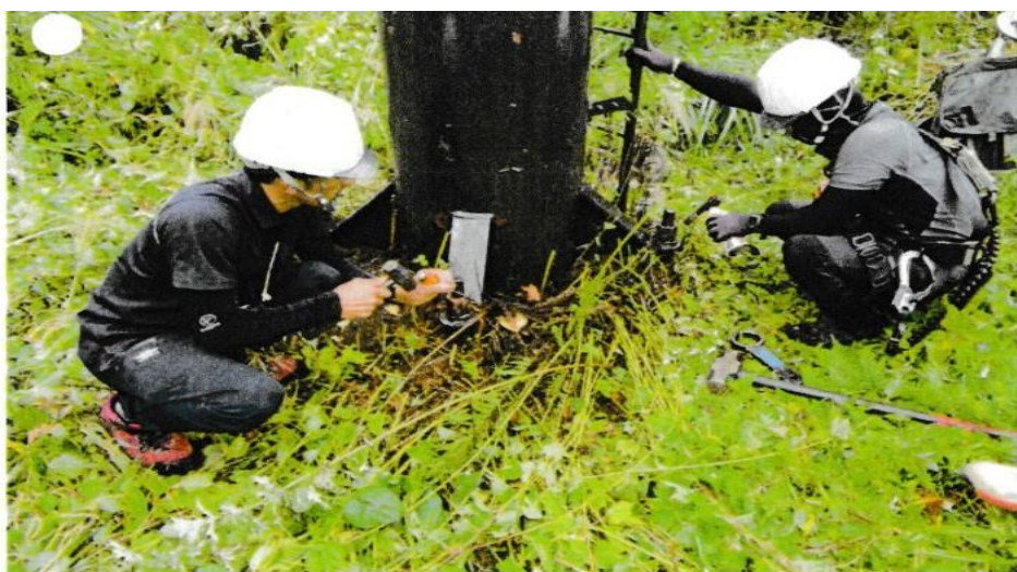
支柱立て起こし工事