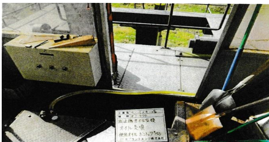
減速機オイル交換工事