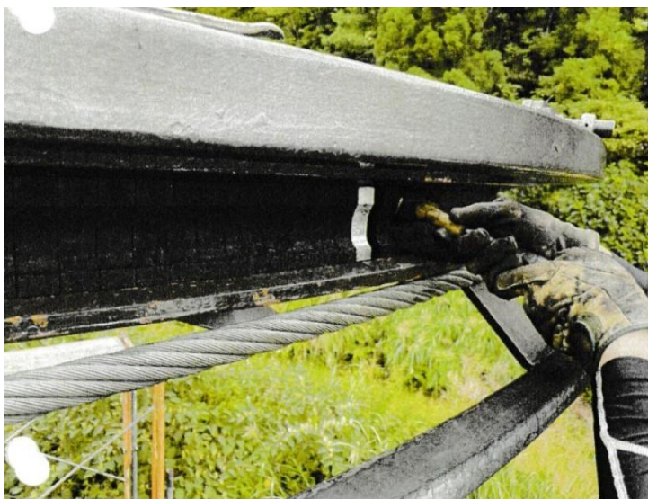
折返し滑車ゴムライナー交換工事