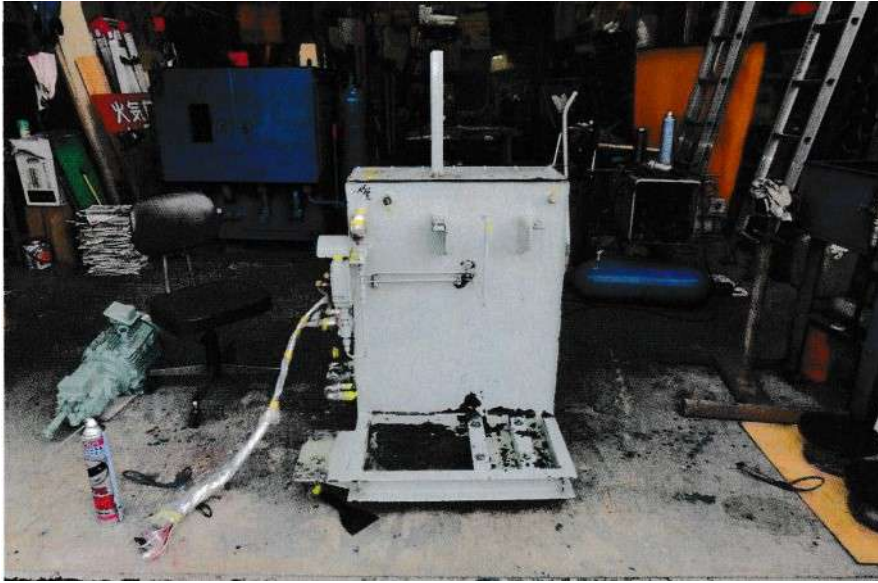
油圧緊張ユニットオーバーホール