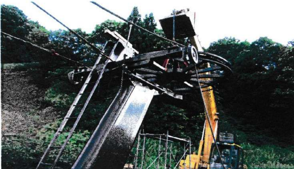
山頂折返し滑車軸受け交換工事