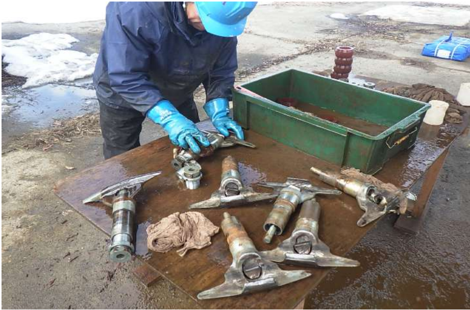
メンテナンス（握索装置洗浄）