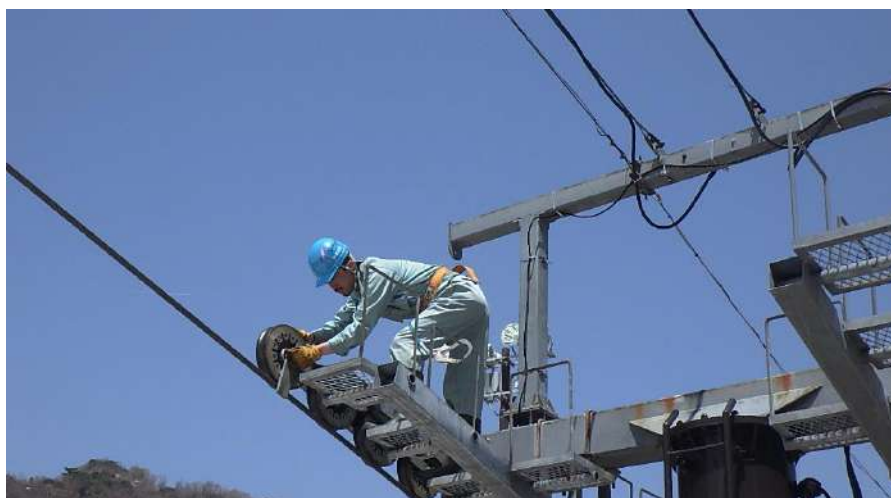
索輪メンテナンス