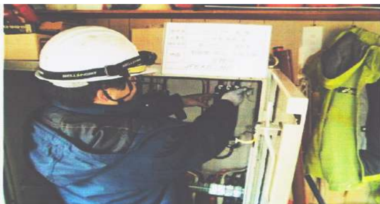
制御盤、操作盤電気部品交換工事