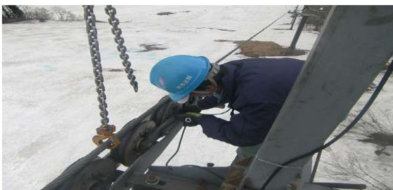
索道メンテナンス